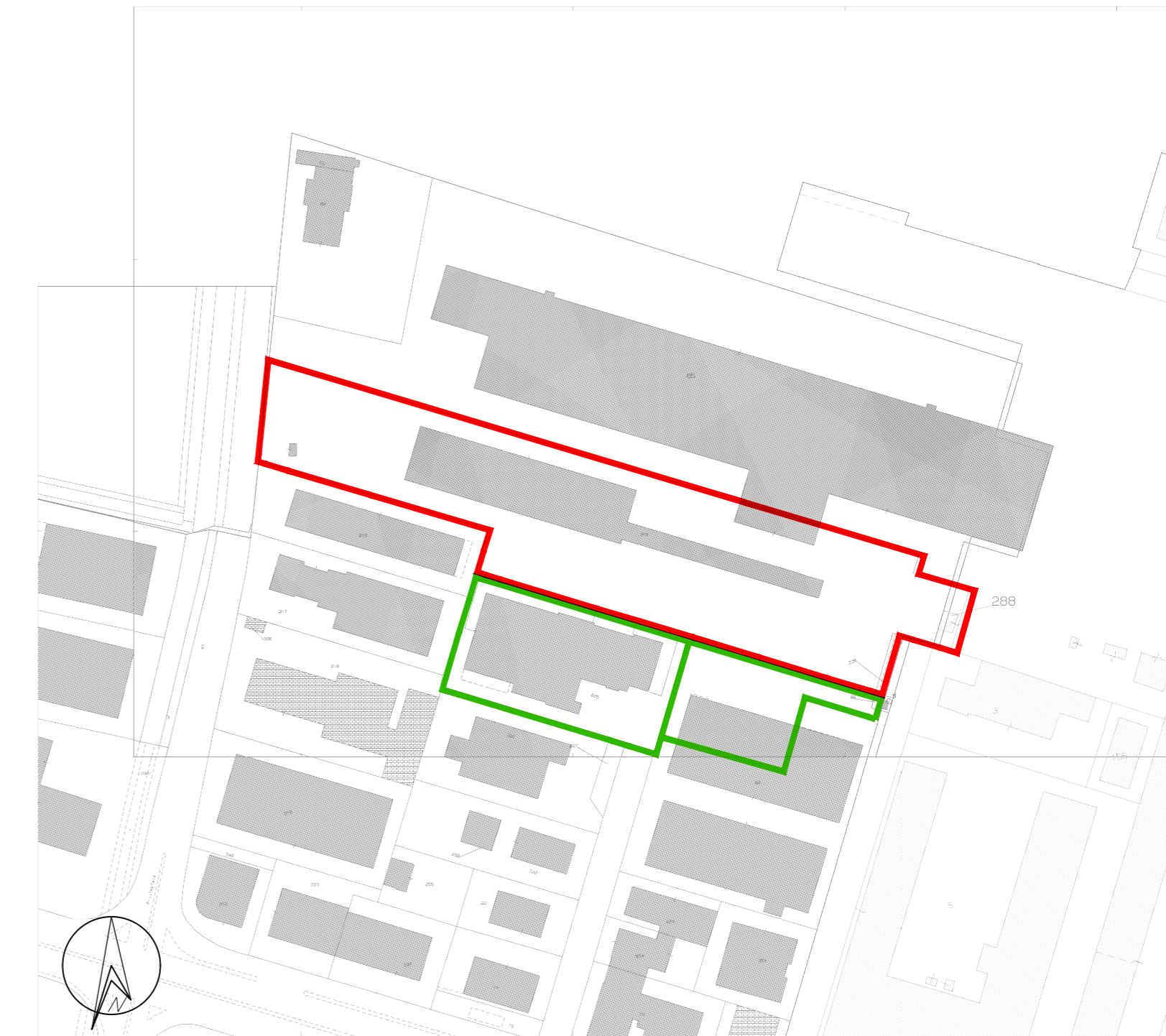
Planimetria Catastale (Unione: Fg. 22 e Fg.23) Scala 1:2000

— AREA AD INTERVENTO DIRETTO AMBITO 29.42 Localizzazione sede Gelostar : Fg 22 mapp 225 e mapp 67 parte