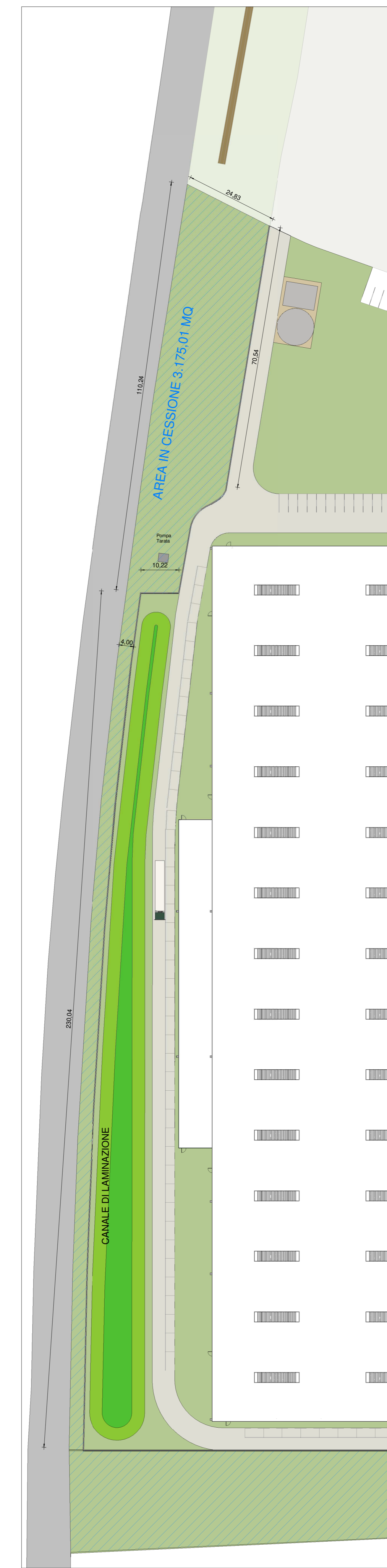
VERDE IN CESSIONE SCALA 1:600