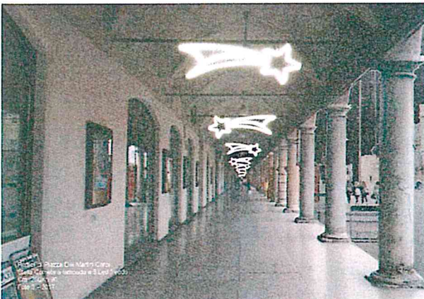
Piazza Duomo Carpi Ornatore e Illuminazione Ice Lights Foto 8/2017