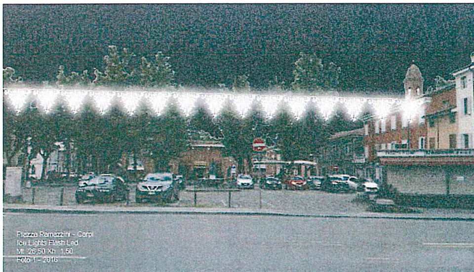
Piazza Ramazzini - Carpi Ice Lights Flash Led Mt. 26,50 Xh. 1,50 Foto 1 - 2016