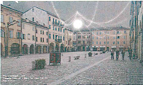
Piazza Duomo - Carpi Cappella Paganelli - Banca Tiro - Dent. Cini 200 Foto 8/2017

Pec: restauro.patrimonio@pec.comune.carpi.mo.it