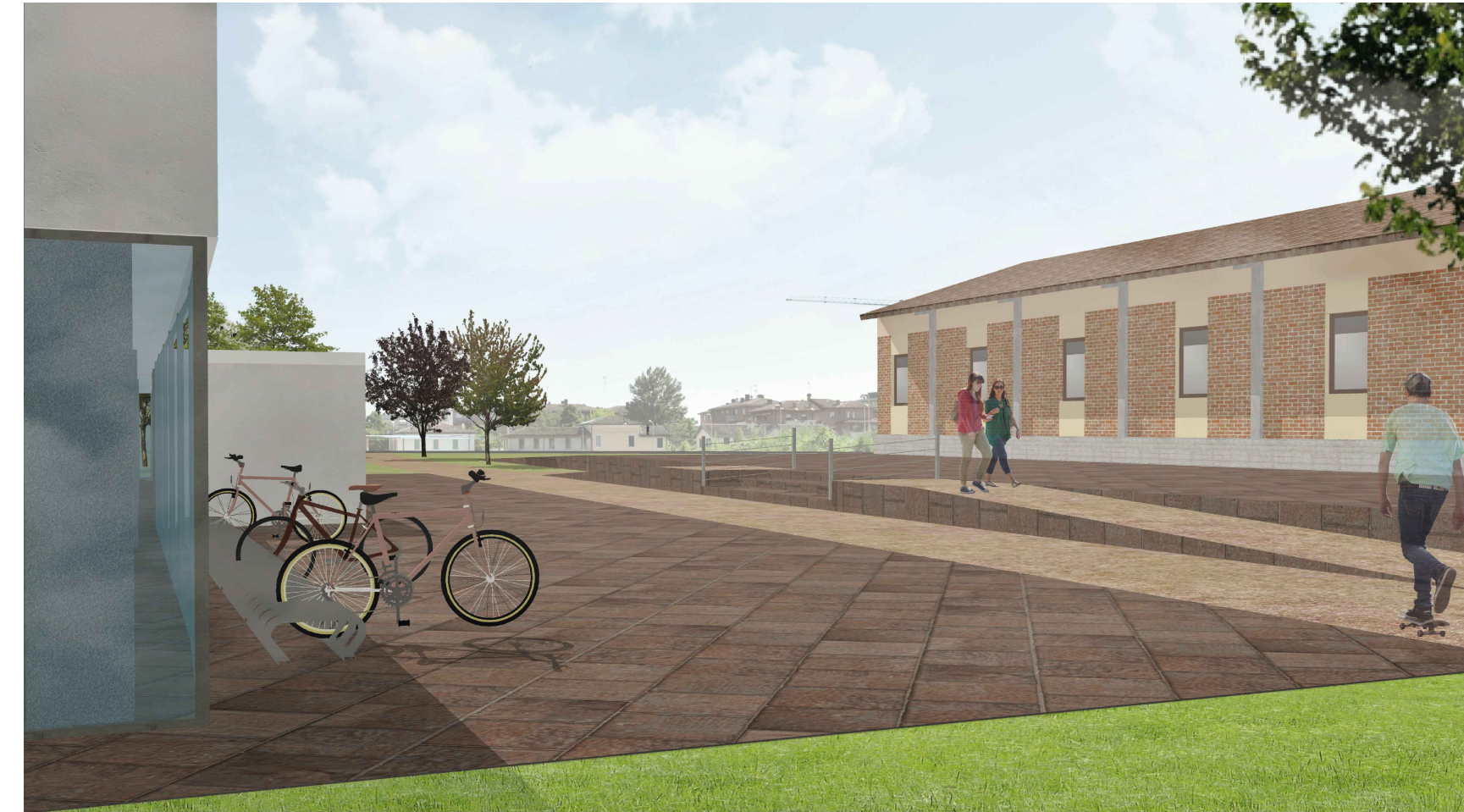
2. VISTA CONCETTUALE DA NORD RAMPA DI COLLEGAMENTO COL MAGAZZINO COMUNALE ESISTENTE