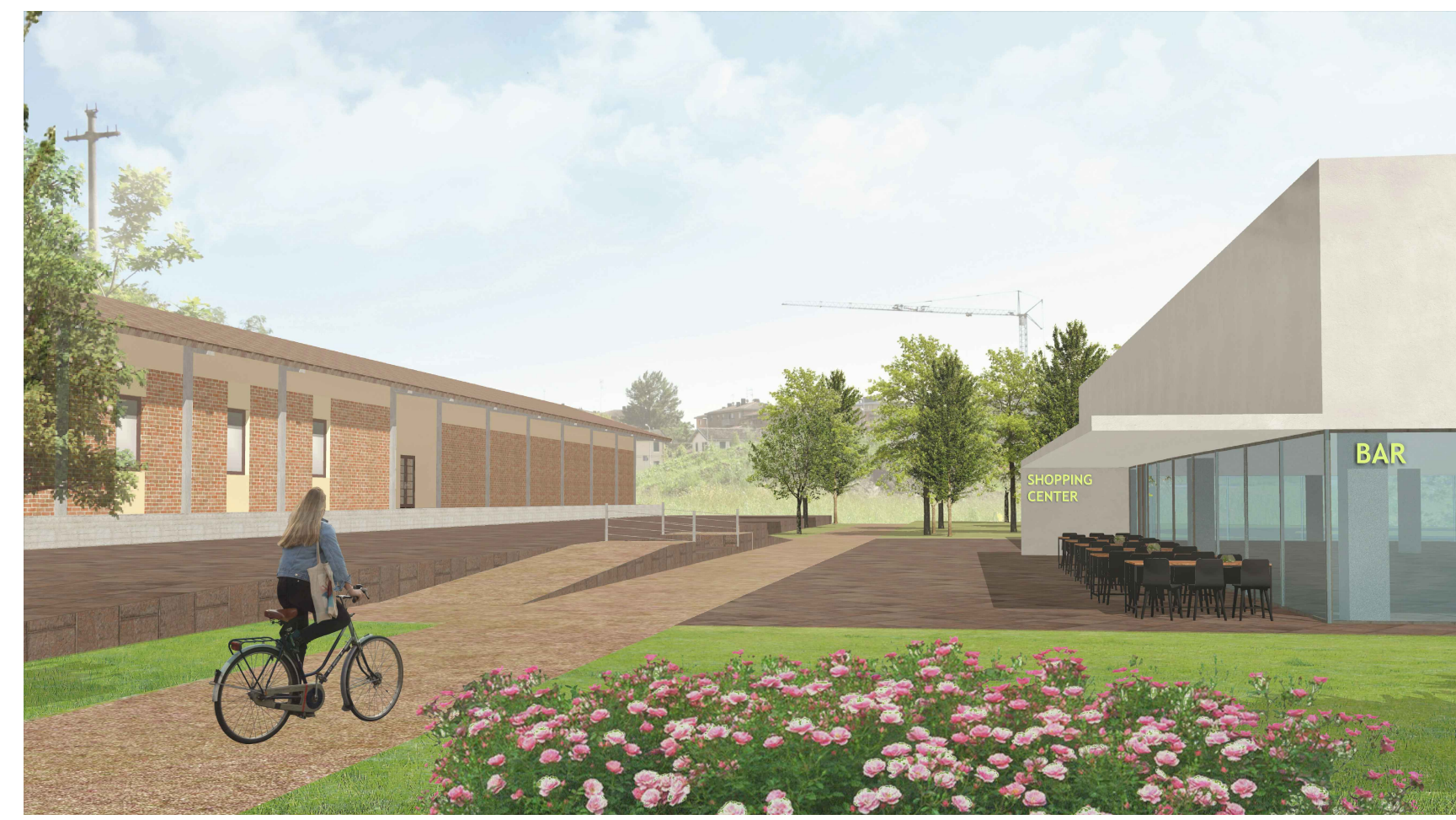
1. VISTA CONCETTUALE DA SUD DELLA CICLABILE IN PROGETTO E DEL CENTRO COMMERCIALE