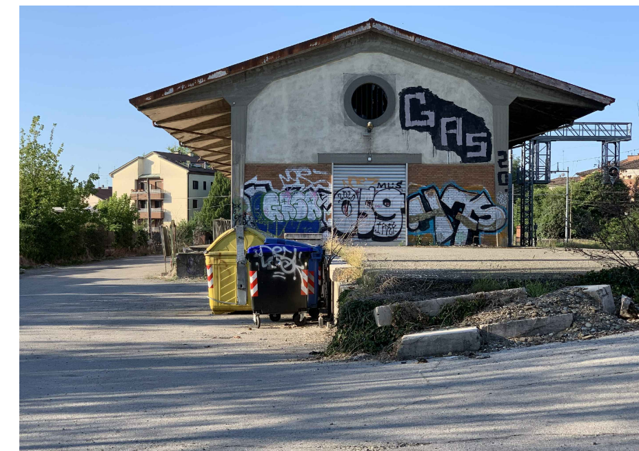
A. MAGAZZINO COMUNALE ESISTENTE