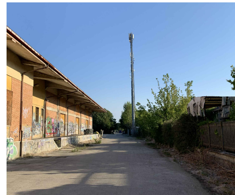
B. AREA TRA MAGAZZINO COMUNALE E COMPARTO

SULLA PORZIONE OVEST DEL COMPARTO ESISTE ATTUALMENTE UNA LINEA DI DEMARCAZIONE FISICA IMPORTANTE, CON UNA RECINZIONE ED UN SIEPE DI SEPARAZIONE TRA IL LOTTO DI PERTINENZA DEL MAGAZZINO COMUNALE E L'AREA DI PROPRIETÀ, RIENTRANTE NEL COMPARTO DI PROGETTO. IL LOTTO DI PERTINENZA DEL MAGAZZINO COMUNALE RISULTA INOLTRE RIALZATO DI CIRCA 55 CM RISPETTO AL LIMITROFO PIANO DI CAMPAGNA ALL'INTERNO DEL COMPARTO DI INTERVENTO. IL PROGETTO PREVEDE LA ELIMINAZIONE DELLE BARRIERE FISICHE DI SEPARAZIONE E LA REALIZZAZIONE DI UN ASSE DI MOBILITÀ 'DOLCE', UNA PISTA CICLABILE IN DIREZIONE NORD SUD, CHE CORRE PARALLELA ALLA FERROVIA, DANDO CONTINUITÀ AL PERCORSO GIÀ ESISTENTE CHE PROVIENE DA SUD.