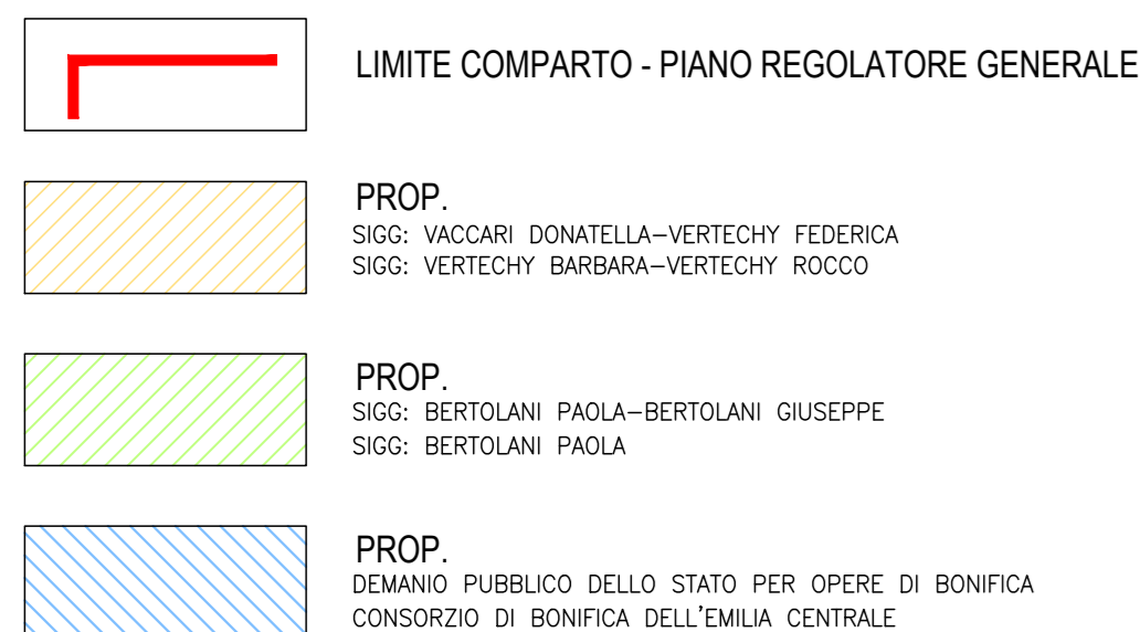
ESTRATTO DI MAPPA CATASTALE FOGLIO 122 - MAPPALE 75-77-78-79-81-217-234