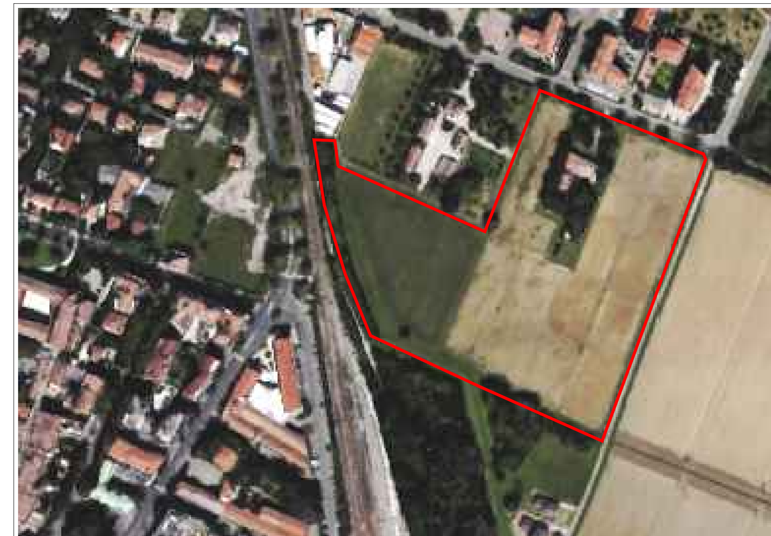
ESTRATTO AEROFOTO - (particolare)