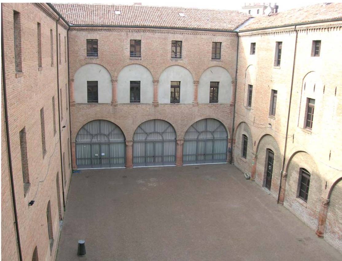
4 – Veduta dal secondo piano dell’edificio verso “Palazzo Castelvecchio”. Gli spazi interni avranno delle aperture a shed che consentiranno di intravedere le facciate storiche interne.

L’impianto di riscaldamento è del tipo tradizionale a termosifoni in ghisa; la caldaia centralizzata per tutto il plesso scolastico è posta nel corpo di fabbrica a nord. L’impianto elettrico è di tipo tradizionale con componentistica e canale risalenti agli anni ‘60. I punti luce saranno costituiti da plafoniere a sospensione a luce diretta/indiretta con lampada fluorescente di disegno semplice, non invasivo e di profilo sottile.