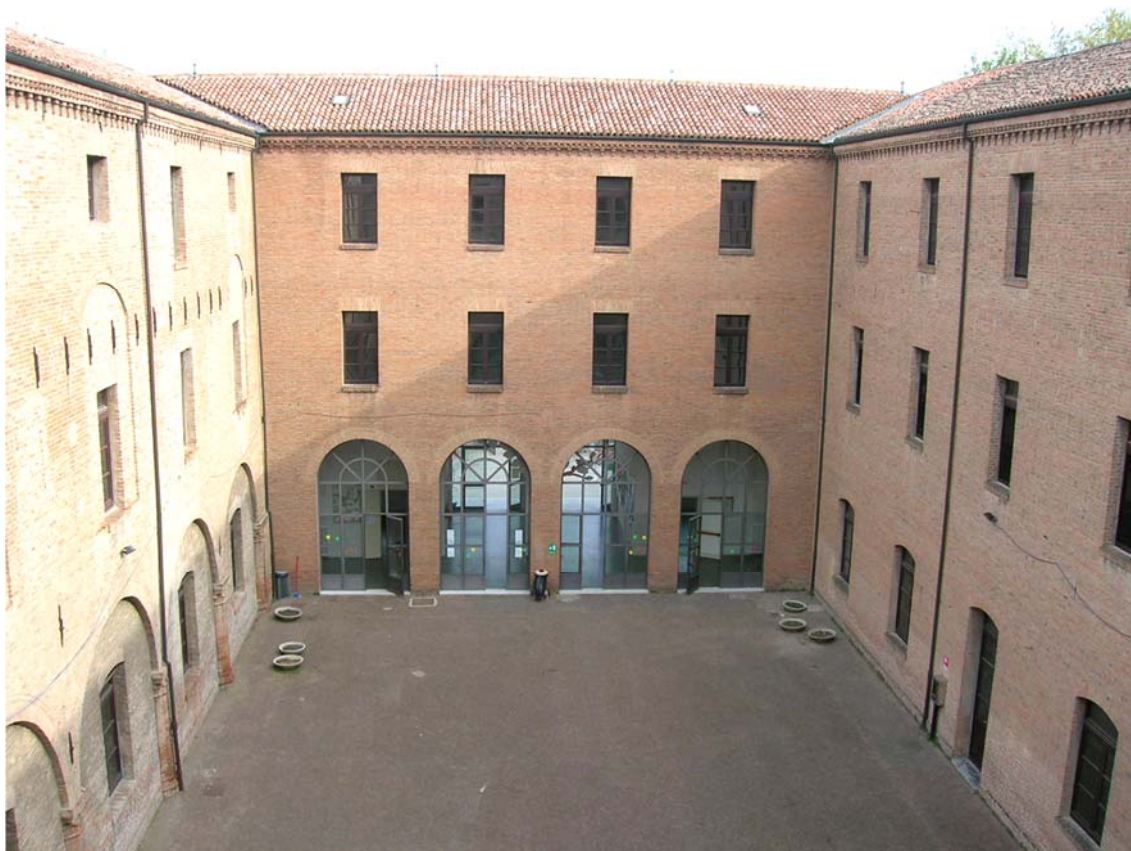
3 – Veduta del cortile interno lato est; in questa facciata del fabbricato, realizzata nel 1953-1954, è previsto l’innesto con la parziale copertura dello spazio polivalente.

I saggi sugli intonaci eseguiti nel 1996 e nel 2000, non hanno evidenziato la presenza di alcuna emergenza o di eventuali decorazioni od affreschi.