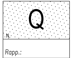
Tavola: PROGETTO DEFINITIVO OPERE A VERDE Note: RELAZIONE

Ubicazione: CARPI - VIA TRE PONTI ANG. VIA CORBOLANI