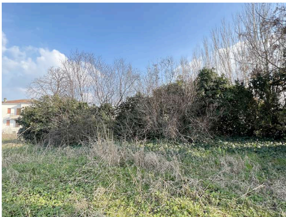
veduta gruppo arbustivo da ovest

Composizione: Osmanthus aquifolium , Viburnum tinus , Taxus baccata , Viburnum davidii , Osmanthus armatus , Photinia x fraseri , Laurus nobilis