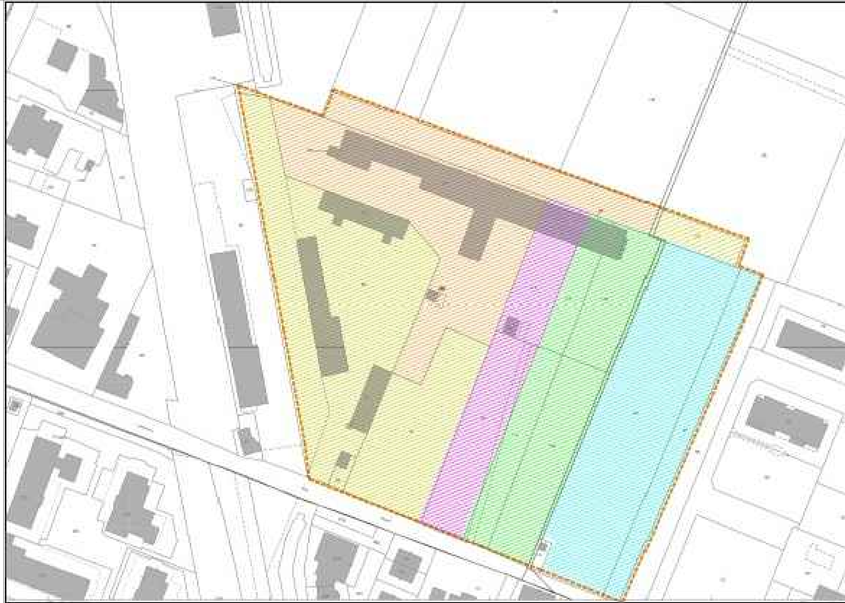
Estratto di mappa catastale - foglio 123 / 125