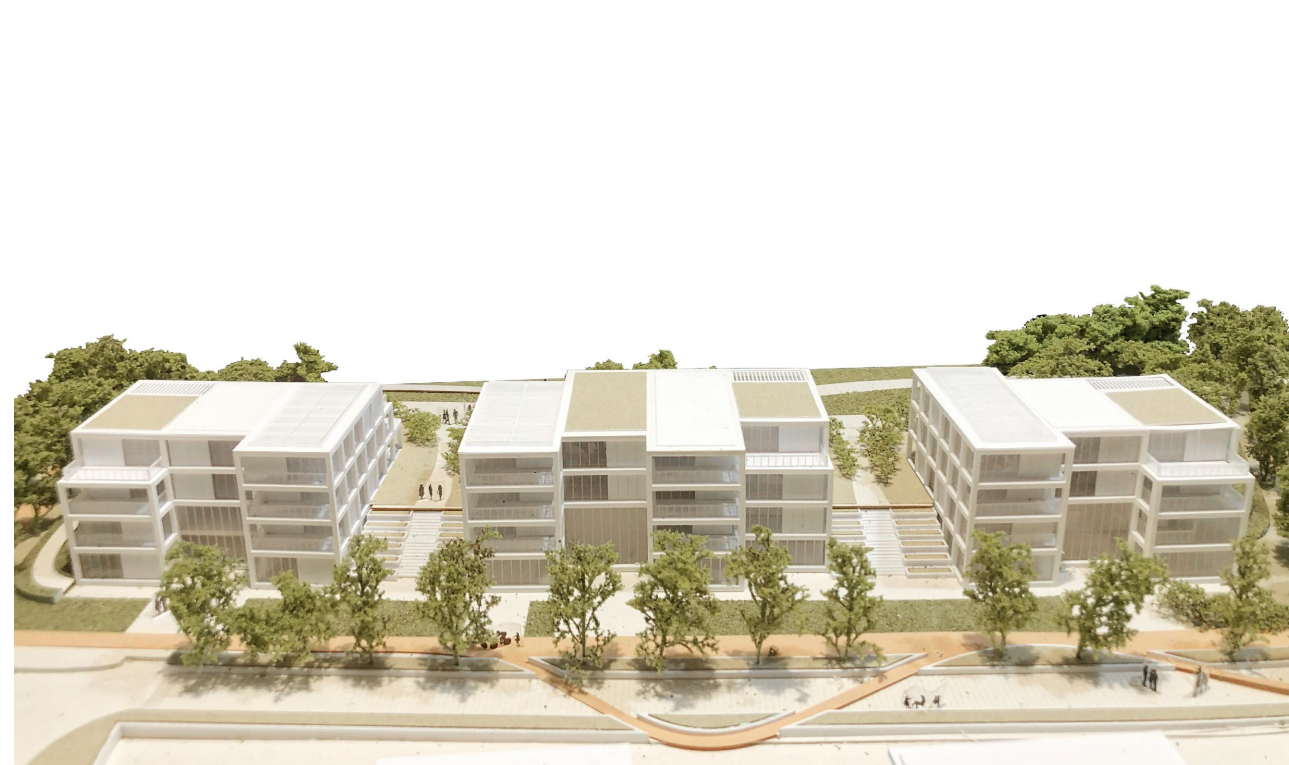
BOULEVARD/PIATTAFORMA UNICA | LOTTO 2