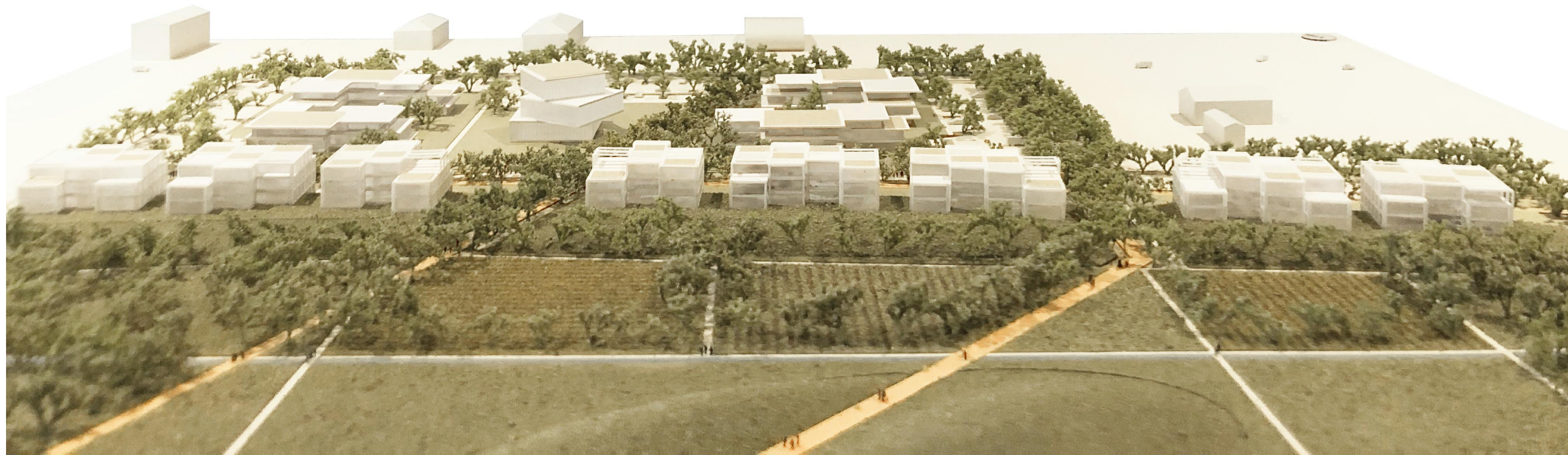
RESIDENZE FRONTE PARCO | COMPARTO A