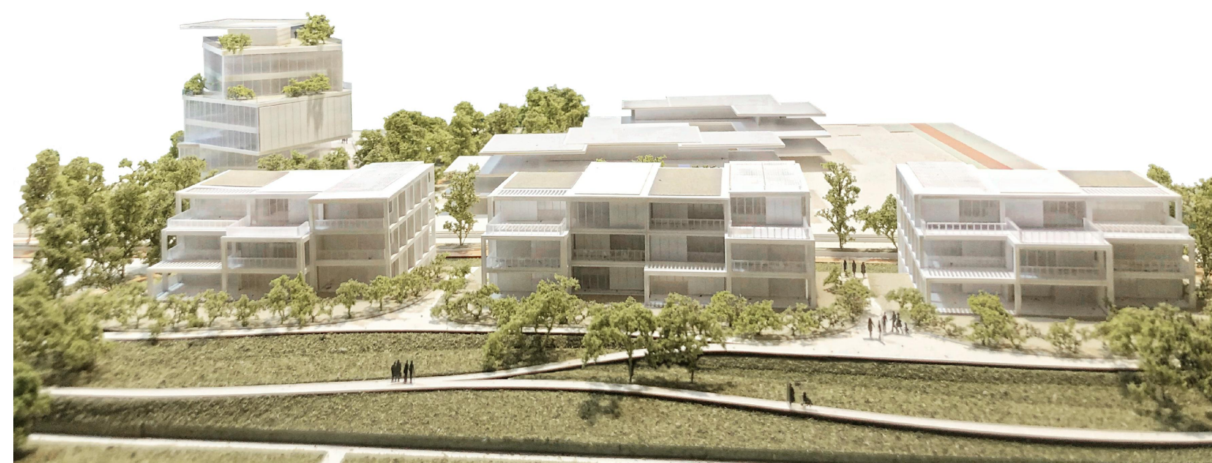
RESIDENZE FRONTE PARCO | LOTTO 2