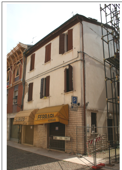
Foto da corso Marconi