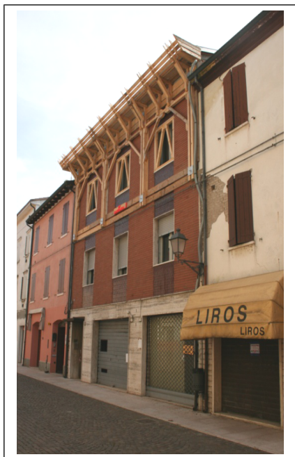
Foto da corso Marconi