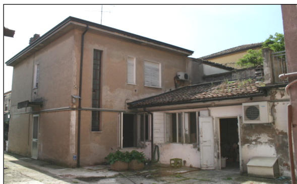
Foto da Corso Marconi cortile interno