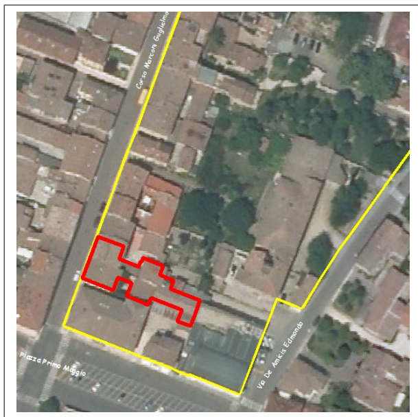
Aggregato Edilizio e UMI