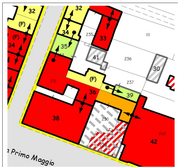
Esito della valutazione danni e perimetrazione UMI