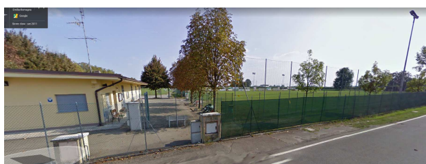
Via Gambisa n. 600 - Campi di Calcio frazione di Limidi (Soliera)