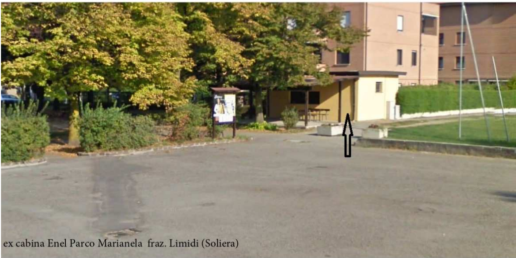
ex cabina Enel Parco Marianela fraz. Limidi (Soliera)