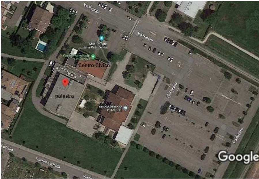
Immagini ©2023 Maxar Technologies, Dati cartografici ©2023 20 m Via Papotti, 18